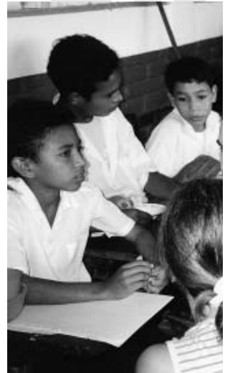
El sector més pobre ha sigut el més perjudicat per les catastrofes naturals

I així vam arribar al 2001, quan tot just Nicaragua començava a recuperar-se dels estralls de l'huracà Mitch i una nova desgràcia, aquesta vegada de caràcter econòmic, s'abocava sobre el país: la caiguda dels preus del cafè en els mercats internacionals, la principal font d'ingressos de l'economia nicaragüenca.