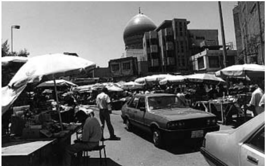
La població iraquiana viu impotent les decisions i accions dels seus dirigents així com les dels governs i multinacionals interessats en controlar la zona

Des de llavors, la misèria i el patiment han estat la norma en la població iraquiana. I dotze anys d'embargament van portar la situació fins a