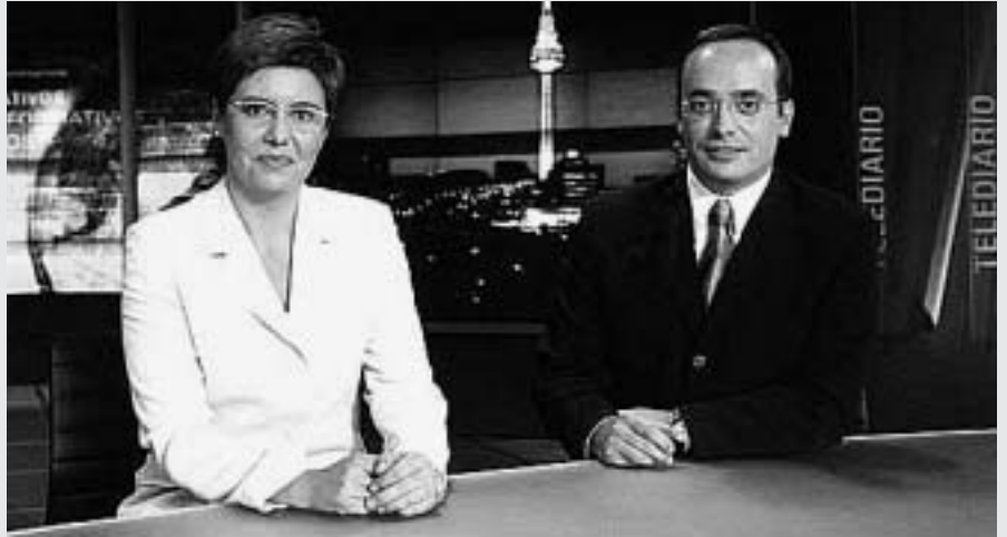
La manipulació dels informatius de televisió ha quedat palesa en aquests darrers mesos

Mientras eso se ha dicho en Johannesburg, el presidente de Estados Unidos, que ha boicoteado la cumbre y se ha negado a ratificar sus protocolos, ha iniciado la guerra en Iraq. Es una guerra por el petróleo, claro, y también por el agua. Iraq tiene las segundas reservas mundiales de crudo, y los dos ríos más importantes de Oriente Medio. Mientras resuenan tambores de guerra, el "chapapote" de las playas gallegas nos recuerda qué hay detrás de todo eso. La guerra permanente contra la Naturaleza, declarada por un sistema económico insostenible que