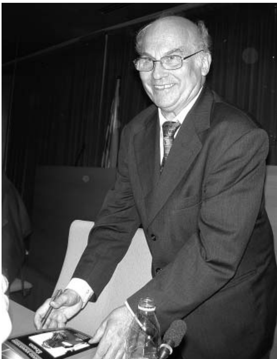
Ryszard Kapuscinski, el desembre passat a la Universitat Autònoma de Barcelona

Centralització del capital i la tecnologia moderna, reafirmació de la identitat (nacionalisme i fonamentalisme), oposició a una globalització deshumanitzada, marginalització de la perifèria —entre països i dins mateix dels països i regions—, desigualtat en el mateixi de les famílies, amb les dones i els nens com a primeres víctimes de les guerres. I la pobresa. Una pobresa que, per al que la pateix, és sobretot una "falta de perspectiva" i una barrera psicològica, assenyala Kapuscinski. "Pensen que no hi ha sortida. Per això els pobres no es rebel·len mai, perquè la pobresa mata l'ànim de la gent".