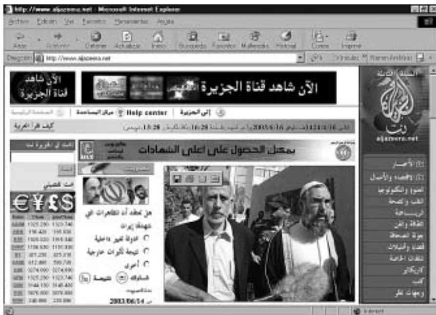
L'aparició d'Al-Jazeera ha suposat una alternativa als monstres occidentals de la informació global oficialitzada

No podem analitzar en poc espai què és el què ha passat a l'Iraq, entre altres raons pel fet que les conseqüències del conflicte encara s'han de conèixer en tota la seva amplitud. Només el temps i el treball dels historiadors serà capaç d'aportar la llum necessària sobre el que haurà estat el primer gran conflicte bèl·lic del segle XXI, un conflicte que, de fet, entronca de ple amb el que fou el darrer gran conflicte bèl·lic dels segle XX: la guerra del Golf de 1991, també amb el domini del petroli com a rerefons. Tampoc no és fàcil, en el poc espai de què disposem, analitzar