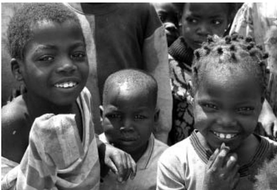
La llarga experiència de Kapuscinski a l'Àfrica fa d'ell un gran coneixedor de la problemàtica del continent del sud

El periodista i escriptor Ryszard Kapuscinski, "el millor reporter del