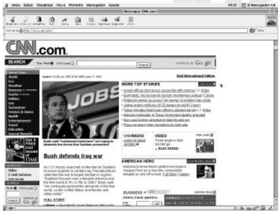
L'explosió els darrers anys de l'ús d'internet per part dels ciutadans del món ens ha donat la oportunitat de contrastar una mica més les informacions amb suposat crèdit

Internet explica, doncs, el secret d'una part de les mobilitzacions ciutadanes que haurien estat abans impossibles. Però, a més, cal recordar que la guerra del Golf del 1991 va ser una guerra “vista” en directe a través d'una única i potent televisió: la CNN, mentre que el conflicte del 2003, els ciutadans del món occidental “hem descobert” que hi ha una altra manera de veure les coses, a través d'una televisió tan global com la CNN que ens en dona una visió diferent: Al-Jazira. Aquesta televisió és la finestra indiscreta que ens ha acabat d'obrir els ulls en relació a aspectes que la CNN ens amagava. I si sempre s'ha dit que una imatge val més que mil paraules, les difoses per Al-Jazira ens han fet adonar —per si hi havia algú que encara en tenia dubtes— que de guerres netes no n'hi ha i que de pobles oprimits i explotats n'hi continuen havent molts. Al-Jazira ens ha fet “adonar” que les guerres, per tecnològiques i sofisticades que siguin, causen víctimes innocents i danys “intangibles” impossibles d'a-