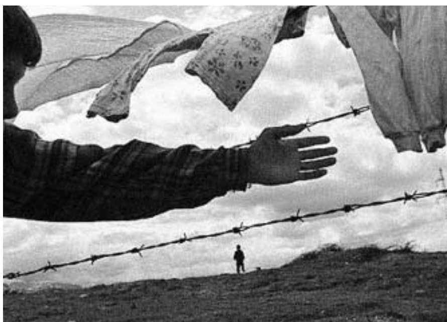
La devastació de la regió balcànica ha deixat una situació de difícil estructuració per les tensions internes que encara perduren

En el cas de Bòsnia, en primer lloc, set anys després d'haver-se signat els Acords de Dayton, hi ha encara importants dèficits que cal afrontar. D'entrada, malgrat que gairebé un milió de persones han pogut tornar allà on residien abans de l'esclat de la guerra, són més de 360.000 persones les que segueixen sense poder-ho fer. En molts d'aquests casos les raons són, per una banda, la por i la inseguretat davant l'hostilitat que puguin trobar-hi i, per l'altra, les enormes incerteses en relació amb el futur que allà els espera. No obstant això, és pertinent esmentar un