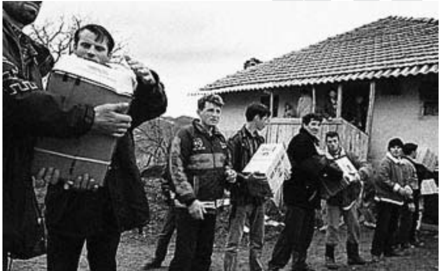
Kosova rep ajuda humanitària mentre els governs no aconsegueixen preveure com serà el futur més immediat

Finalment, la situació potser més complexa de les tres esmentades és la de Kosova, on gairebé tres anys després de l'adopció de la resolució 1244 del Consell de Seguretat de l'ONU que donava pas a la fase postbèl·lica, un dels principals problemes seguia essent precisament la manca de seguretat, la qual cosa impedia no només el retorn de persones desplaçades i refugiades, sinó fins i tot el desplaçament quotidià de les famílies que hi vivien. Moltes, per exemple, han d'estar encara contínuament protegides per efectius de la KFOR (les forces internacionals). A aquesta notable inseguretat, però, cal afegir-hi també les importants necessitats humanitàries